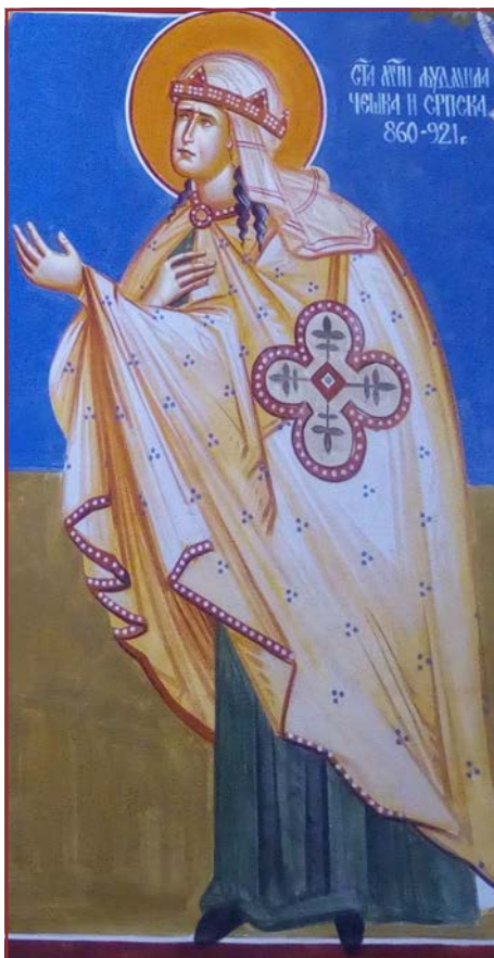
Sv. Ludmila v modlitbě. Chrám sv. Jovana v Bare (Černá Hora), kaple sv. Rostislava

Láska k Bohu se u ní projevovala modlitbou, půstem, skutky milosrdenství, kterými napodobujeme Boha, jak nás to učí Kristus. Na chybnou cestu nenapodobení Boha upo-