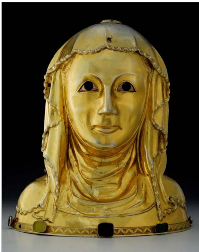
Busta sv. Ludmily – pravděpodobně nejvěrnější historické zobrazení podoby sv. Ludmily (z r. 1330, pražský Hrad)

křtem, při němž nám Pán Bůh dává pocítit cosi z nebeské blaženosti, která nás očekává, když vytrváme. Křesťanská cesta je ovšem cesta oběti, nesením kříže (Mat 10,38). Přicházíme, abychom byli zachráněni Pánem Ježíšem Kristem, a spolu s ním přijímáme svůj kříž, obětujeme sebe sama. Máme vstupovat těsnou branou a kráčet úzkou cestou (Mat 7,14), abychom se stali schopnými přebývat v Božím Království,