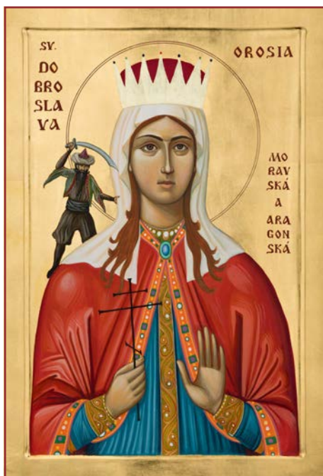
Sv. mučednice, princezna velkomoravská Orosia – Drobroslava

(r. 882) na místě jejího umučení nějaký pastýř, který se byl občerstvit u pramene, prýšticího tam od doby mučednického zápasu sv. Orosie. Jsa veden nebeským zjevením, vyzdvihl ostatky mučednice a přenesl je do města Yebry, kde podle pokynu shůry nechal v chrámu její hlavu, a pak do města Jacy, kde v chrámu na oltář uložil její tělo. Přenesení ctihodných ostatků bylo dle legendy provázeno zázraky.