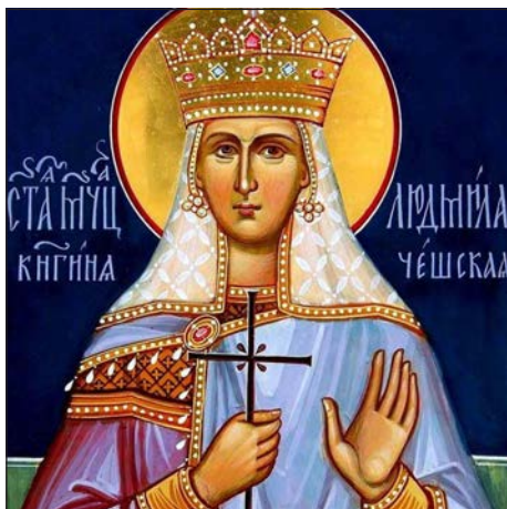
Ruská ikona sv. Ludmily

všichni národové; i rozdělí je od sebe, jako pas-týř odděluje ovce od kozlů; a postaví ovce po pravici své, kozly pak po levici. Tehdy dí král těm, kteří po pravici jeho budou: pojdte, požehnaní Otce mého, buďte dědici Království vám připraveného od ustanovení světa: lačněl jsem, a dali jste mi jísti; žíznil jsem, a dali jste mi píti; hostem jsem byl, a přijali jste mne; nahý jsem byl, a přioděli jste mne; v žaláři jsem byl, a přišli jste ke mně. Tehdy odpovědí jemu spravedliví, řkouce: Pane, kdy jsme tě viděli lačného, a nakrmili jsme tebe? Žíznivého, a dali jsme tobě píti? Kdy pak jsme tě viděli