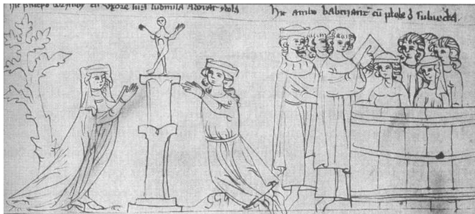
Křest Bořivoje a Ludmily; vlevo se ještě klaní modle, vpravo pak křest (Liber depictus, pol. 14. stol.)

V případě svatých lidí, kteří žili podle Evangelia Kristova, můžeme tušit podle jakých evangelijních slov probíhal posmrtný soud nad jejich duši: „Jestli odpouštíte lidem hříchy jejich, odpustí i vám Otec váš nebeský; jestliže pak neodpouštíte lidem hříchy jejich, aniž Otec váš odpustí vám hříchy vaše.“ (Mat 6,14—15) „Neukládejte sobě pokladů na zemi, kdežto mol a rez kazí, a kde zloději vykopávají a kradou; ale skládejte sobě poklady v nebi, kde ani mol, ani rez nekazí a kde zloději nevykopávají ani nekradou; neboť kde jest poklad váš, tam bude i srdce vaše...“ (Mat 6,19—21)